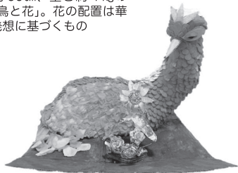
高さ約90cm、重さ約4kgの「不死鳥と花」。花の配置は華道の発想に基づくもの