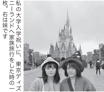
私の大学入学祝いに、東京ディズニーランドへ家族旅行をした時の一枚。右は妹です