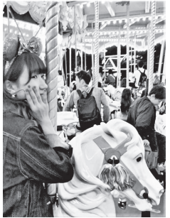
3年前、東京ディズニーランドで翌日、駅で迷い飛行機に乗り遅れたオチ付き（苦笑）