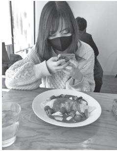
札幌にあるオムライスとパンケーキの専門店写真撮っているところ。オムライスが好きです