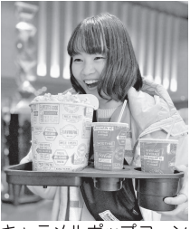
キャラメルポップコーン愛！『アナと雪の女王2』を観に行った際の一枚