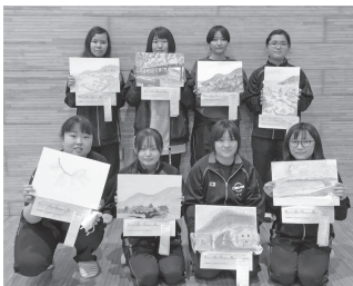
◀高文連道南支部美術地区大会参加の8名 (美術部)