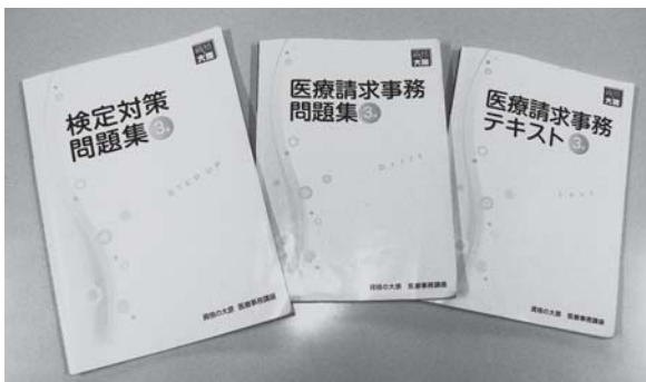
医療事務検定対策テキスト 3冊