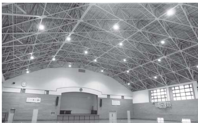
明るくなった体育館