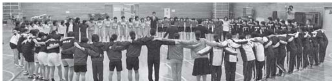
大妻Hearts結成!! 運動部全員で健闘を誓い合いました。