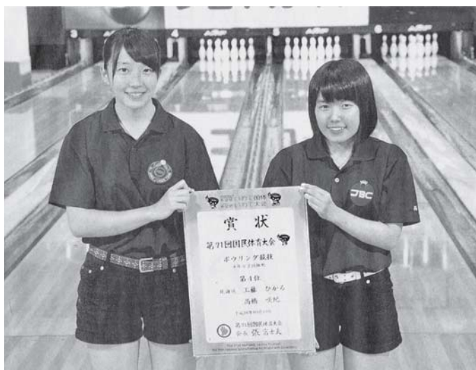
北海道新聞 (夕刊) 2016年11月14日

本校の生徒は、将来役立つ資格取得のため、実習や専門の授業が多い中、部活動と学業を上手に両立させながら高校生活を謳歌している。ボウリングで活躍する二人も、ジュニア教室に通い、力をつけこの度の快挙に至った。この結果に満足せず、日々の努力を続けている。大会成績は次の通り。