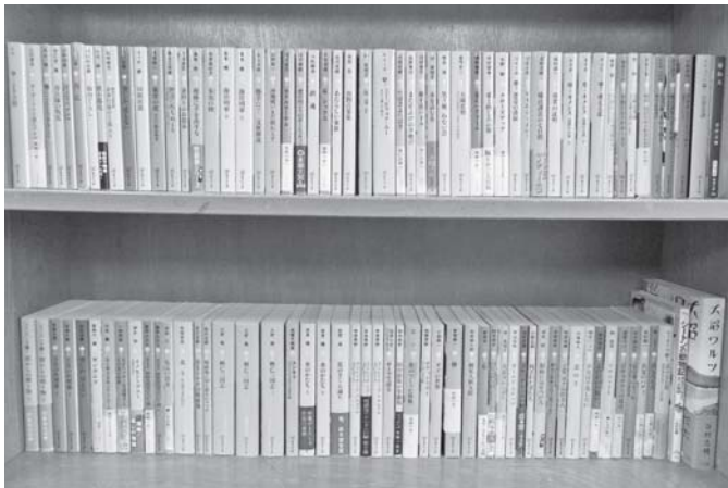
寄贈された100冊の本

9月7日、函館ゆかりの作家、谷村志穂さんが「その海の向こう側」と題して講演を行った。これは一ツ橋文芸教育振興会と北海道新聞社が主催の「高校生のための文化講演会」として開催されたもので、自身のエピソードを交えながら、豊かな高校時代となるための心構えを語って下さり、小説家になったいきさつや毎年夏を過ごす函館の魅力についての話にも生徒は食い入るように聞き入っていた。併せて講演会の他、文庫100冊の寄贈もあり、早速生徒は図書室で新しい本を手に取り、室内で読書を楽しんでいる。 谷村さんは函館を舞台にした映画の原作として、「海猫」が有名であるが、近作として昨年の7月に「大沼ワルツ」が上梓されており、図書室にもサイン入り本が寄贈されている。