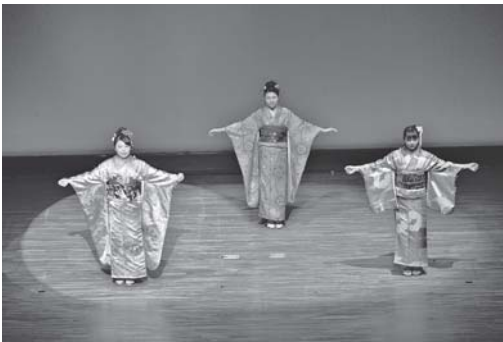
ファッションショー・着物